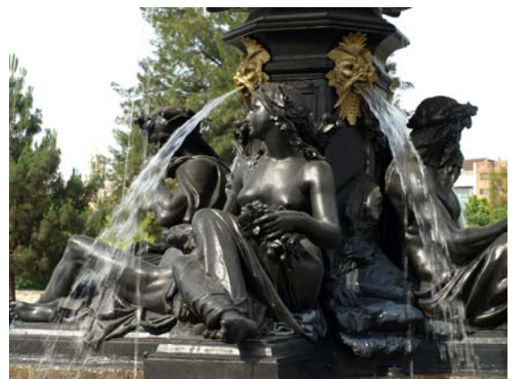
Detalle de fuente impermeabilizada

Extensa gama de productos químicos diseñados con una alta tecnología e innovación, destinados a cubrir cualquier tipo de necesidad surgida en el sector de la construcción. Ver Página 2