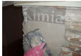
APLICACION TECTORIA M15