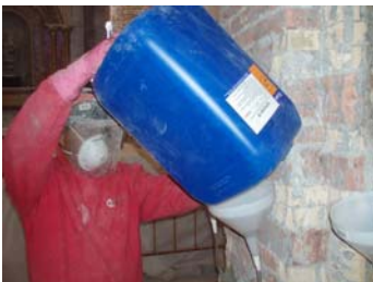
INYECCION DE KIMICOVER IN