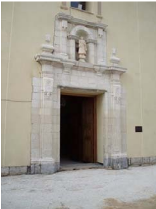
FACHADA PRINCIPAL PARROQUIA