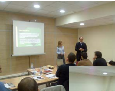
Imágenes de la formación