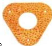
Disco de Tungsteno